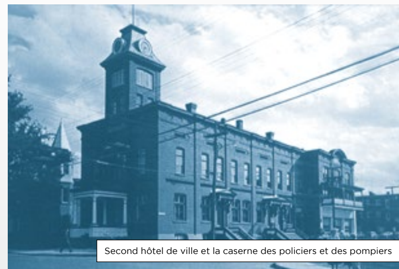
Second hôtel de ville et la caserne des policiers et des pompiers