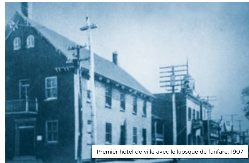
Premier hôtel de ville avec le kiosque de fanfare, 1907

Ce premier hôtel de ville est détruit par l'incendie qui dévasta une grande partie du centre-ville le 30 juillet 1911.