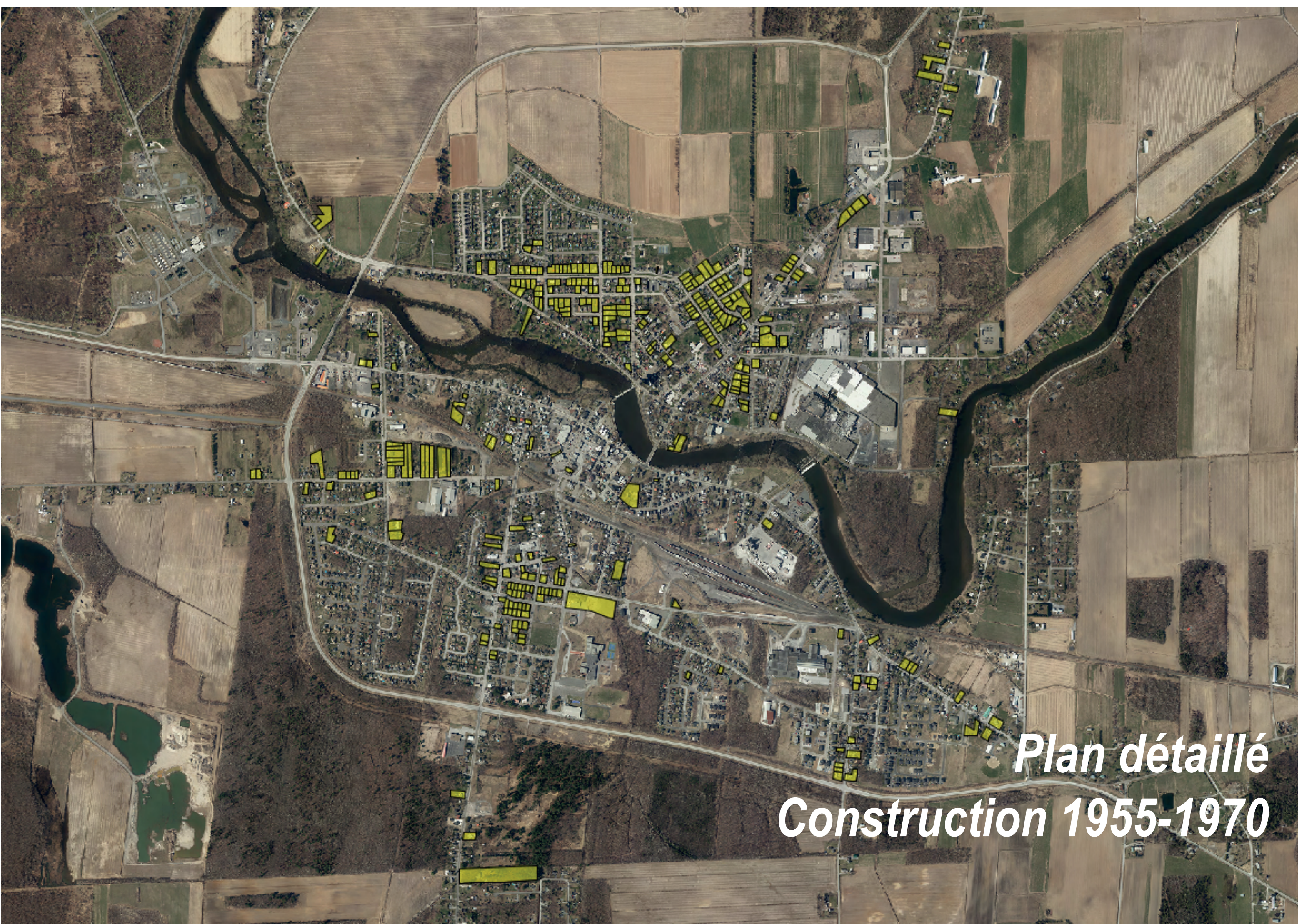
Plan détaillé Construction 1955-1970